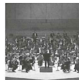
仙台フィルハーモニー管弦楽団