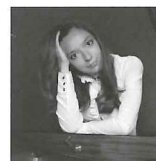
ユリアンナ・アヴデーエワ