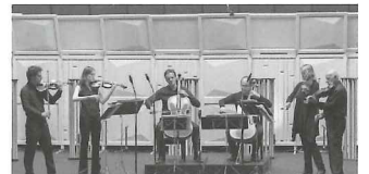
ルツェルン祝祭管弦楽団のソリストたち