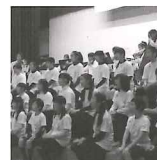
相馬子どもオーケストラ &コーラス