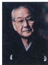
野村のむら 萬 まん

1930年(昭和5年)生まれ。父・故六世万蔵(人間国宝)に師事。4歳で初舞台。日本を代表する狂言の第一人者として、1997年重要無形文化財個人指定(人間国宝)の名誉を受ける。2001年に日本藝術院会員、2008年に文化功労者となる。現在も多くの舞台上で活躍する傍ら、(公社)日本芸能実演家団体協議会会長、(公社)能楽協会理事長として広く日本の芸能文化の振興発展に尽力している。