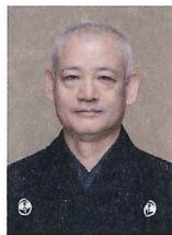
粟谷あわや 能夫 よしお

1930年(昭和5年)生まれ。父・故六世万蔵(人間国宝)に師事。4歳で初舞台。日本を代表する狂言の第一人者として、1997年重要無形文化財個人指定(人間国宝)の名誉を受ける。2001年に日本藝術院会員、2008年に文化功労者となる。現在も多くの舞台上で活躍する傍ら、(公社)日本芸能実演家団体協議会会長、(公社)能楽協会理事長として広く日本の芸能文化の振興発展に尽力している。