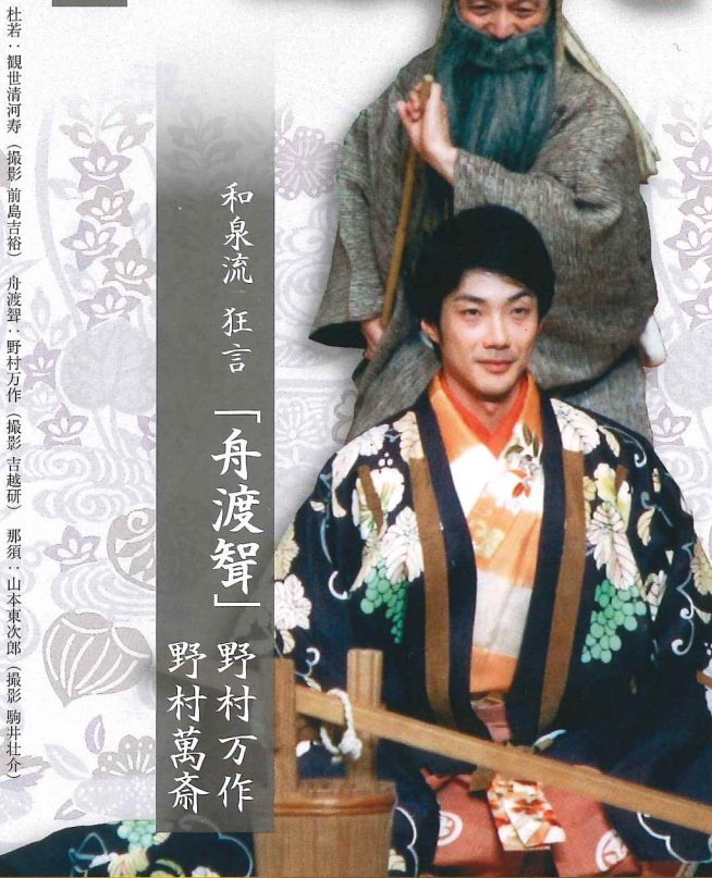
和泉流 狂言「舟渡智」