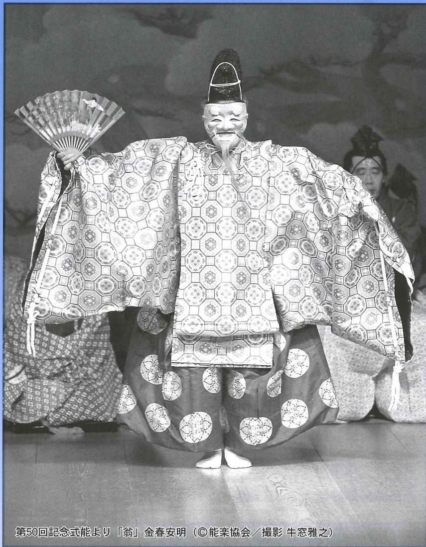
第50回記念式能より「翁」金春安明