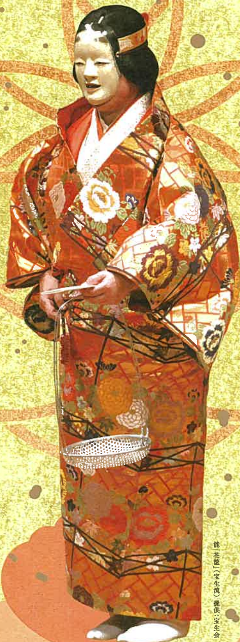
能花筐(宝生流)

※電話・WEB予約開始日にチケットが売り切れた場合、窓口での販売はございません。