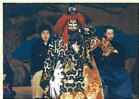
シテ：九世観世鏡之丞

一方、都では変事に見舞われ、勅命を受けた比叡山の僧正たち(ワキ・ワキツレ)が車で宮中へと急いでいた。不穏な雷雨が降りしきるなか、善界坊(後シテ)が飛来して一行の前に立ち塞がるので、僧正たちは一心に折衝をはじめる。すると、不動明王や山王権現が現れて守護し、為す術をなぐした善界坊は虚空へと退散するのであった。