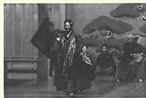
シテ：八世観世鏡之丞

当初、本公演は七月三十日に開催を予定しておりましたが、新型コロナウイルス感染症の流行拡大に伴い、開催日時を変更いたしました。何卒ご了承くださいませよう、お願い申し上げます。