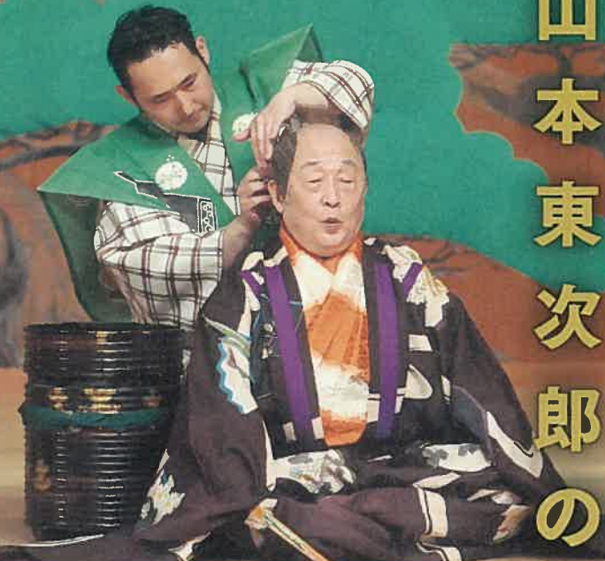
狂言「麻生」山本東次郎