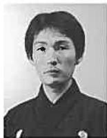
山本 則孝 やまもと のりたか

1970年青森県生まれ。歌人。馬場あき子に師事、歌誌「かりん」編集委員。同志社大学文学部卒業。1991年角川短歌賞、2001年「若月祭(みかづきさい)」で現代短歌新人賞、2012年「エクウス」で芸術選奨文部科学大臣新人賞、葛原妙子賞。短歌研究賞。2016年青森県文化賞。現代歌人協会理事。歌集歌書に「真珠層」「現代歌枕 歌が生まれる場所」「日本の美しい言葉辞典」等。