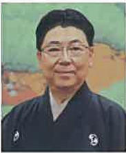
あわや あきお 粟谷 明生

1955年(昭和30年)生まれ。故粟谷菊生(人間国宝・芸術院会員)の長男。故十五世喜多実、友枝昭世、父に師事する。3歳で初舞台『鞍馬天狗』花見。以後、『狸々乱』『道成寺』『翁』『望月』『卒都婆小町』を抜く。平家物語のビデオ化で『月見の段』を能として収録ほか、『大和奏曲抄五体風姿』に出演。重要無形文化財総合認定保持者。著書に『粟谷菊生能語り』『夢のひとしづく・能への思い』。