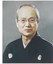
のむら まんさく 野村 万作

1955年(昭和30年)生まれ。故粟谷菊生(人間国宝・芸術院会員)の長男。故十五世喜多実、友枝昭世、父に師事する。3歳で初舞台『鞍馬天狗』花見。以後、『狸々乱』『道成寺』『翁』『望月』『卒都婆小町』を抜く。平家物語のビデオ化で『月見の段』を能として収録ほか、『大和奏曲抄五体風姿』に出演。重要無形文化財総合認定保持者。著書に『粟谷菊生能語り』『夢のひとしづく・能への思い』。