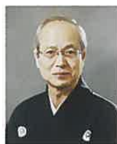
のむら まんさく 野村 万作

1955年(昭和30年)生まれ。故粟谷菊生(人間国宝・芸術院会員)の長男。故十五世喜多実、友枝昭世、父に師事する。3歳で初舞台『鞍馬天狗』花見。以後、『狸々乱』『道成寺』『翁』『望月』『卒都婆小町』を披く。平家物語のビデオ化で『月見の段』を能として収録ほか、『大和奏曲抄五体風姿』に出演。重要無形文化財総合認定保持者。著書に『粟谷菊生能語り』『夢のひとしづく・能への思い』。