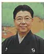
あわ や あきお 粟谷 明生

1949年(昭和24年)生まれ。故粟谷新太郎の長男。5歳で初舞台『花筐』子方 7歳で喜多流十五世宗家喜多実に入門する。1988年発足の「三鈴の会」同人として新作品『鷹姫』国立能楽堂企画公演の新作品『晶子みだれ髪』等に出演、2018年『山姫』を復曲するなど積極的に活動を続けている。重要無形文化財総合指定保持者。2012年第34回観世寿夫記念法政大学能楽賞受賞。2014年「粟谷家所蔵能面選」監修。