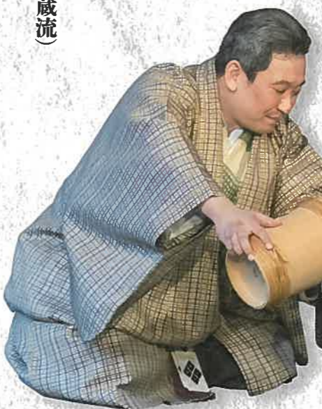
狂言「鬼ヶ宿」 (大蔵流)