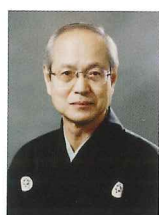
のむら まんざく 野村万作