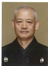
あわや よしお 粟谷能夫

1949年(昭和24年)生まれ。故粟谷新太郎の長男。5歳で初舞台『花筐』子方、7歳で喜多流宗家に入門し故十五世喜多実(喜多実)に師事する。また三鈴の会の同人として新作能『鷹姫』、国立能楽堂企画公演の新作能『晶子みだれ髪』に主演するなど意欲的な活動を続けている。重要無形文化財総合認定保持者。2012年、第34回観世寿夫記念法政大学能楽賞受賞。『粟谷家所蔵能面選』監修。