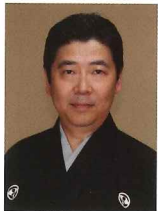
あわや あきお 粟谷明生

1949年(昭和24年)生まれ。故粟谷新太郎の長男。5歳で初舞台『花筐』子方、7歳で喜多流宗家に入門し故十五世喜多実(喜多実)に師事する。また三鈴の会の同人として新作能『鷹姫』、国立能楽堂企画公演の新作能『晶子みだれ髪』に主演するなど意欲的な活動を続けている。重要無形文化財総合認定保持者。2012年、第34回観世寿夫記念法政大学能楽賞受賞。『粟谷家所蔵能面選』監修。