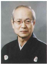
のむら まんさく 野村万作

1931年(昭和6年)生まれ。重要無形文化財各個認定保持者(人間国宝)。祖父・故初世野村萬斎及び父・故六世野村万蔵に師事。3歳で初舞台。早稲田大学文学部卒業。国内外で狂言の普及に貢献。日本芸術院賞、芸術祭大賞、紀伊国屋演劇賞、紫綬褒章、坪内逍遙大賞、法政大学観世寿夫賞、朝日賞ほか受賞歴多数。練馬文化センター名誉館長。