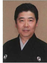
あわや あきお 粟谷明生

1949年(昭和24年)生まれ。喜多流職分、故粟谷新太郎の長男。2012年、第34回観世寿夫記念法政大学能楽賞受賞。5歳で初舞台『花筐』子方、7歳で喜多流宗家に入門し故十五世喜多実(実)に師事する。また三鈴の会の同人として新作能『鷹姫』、国立能楽堂企画公演の新作能『晶子みだれ髪』に主演するなど意欲的な活動を続けている。重要無形文化財総合認定保持者。日本能楽会理事。